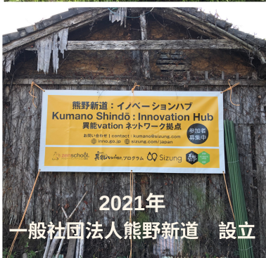
2021年 一般社団法人熊野新道 設立