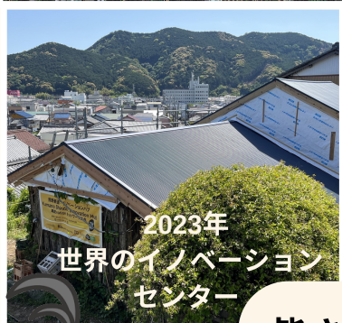
2023年 世界のイノベーション センター