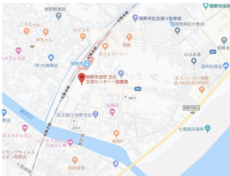
熊野市文化交流センター：〒519-4324 三重県熊野市井戸町6 4 3-2 電話：0597-89-3686