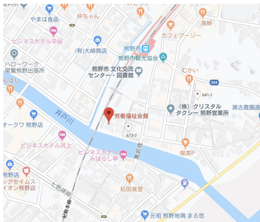
熊野市労働福祉会館：〒519-4324 三重県熊野市井戸町6 7 2-9 電話：0597-85-2817